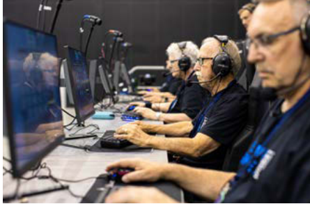
Team Silver Snipers tävlar i Katowice, Polen.