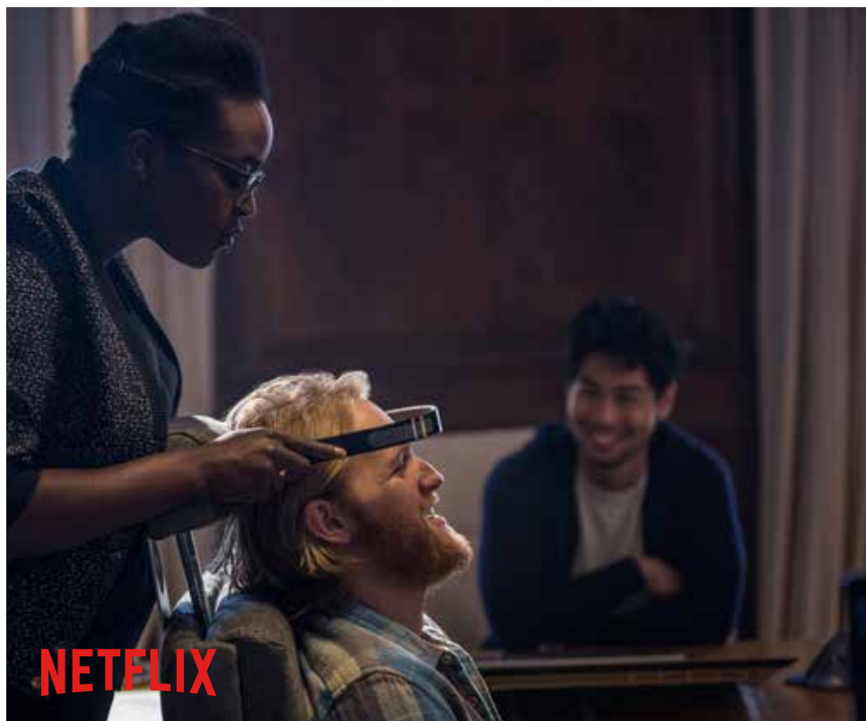
Se Black Mirror på Netflix.

Under våren har en ny våg av science fiction-filmer och serier svept in på bio och i tv-soffan. De har existentiella, hallucinatoriska och experimentella uttryck som handlar mycket om vad det betyder att vara människa i en digital tidsålder. Det grubblas om etiska dilemman med till exempel ny teknik och artificiell intelligens. För dig som inte varit så förtjust i rymdäventyr med luddiga varelser finns en helt ny genre att upptäcka. Tips är filmerna Ett veck i tiden , Annihilation och Interstellar . Serien Black Mirror på Netflix är en bra introduktion med avslutade avsnitt och oväntade vändningar. (DAGENS NYHETER)