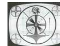
Den första testbilden.