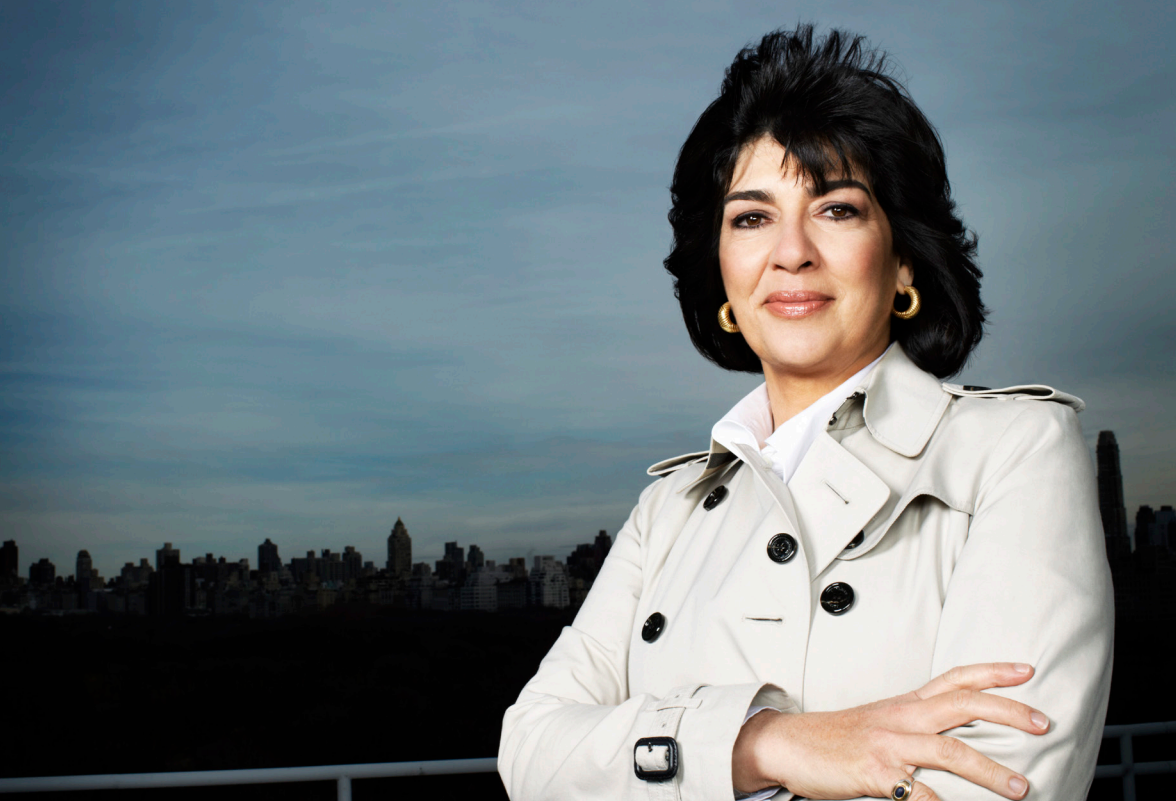
Christiane Amanpour är nyhetsankare på CNN, internationell korrespondent och leder egna intervjuprogrammet Amanpour.